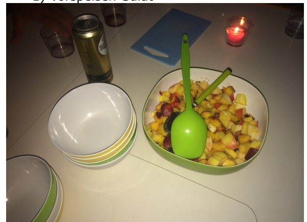
3) Frischer Fruchtsalat