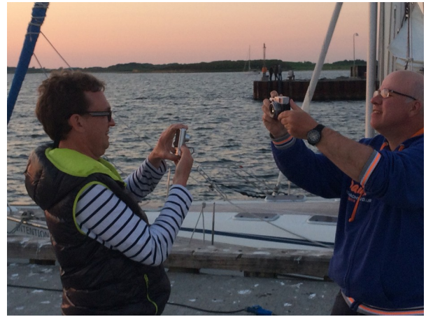
Aber öppe au Seich im Grind