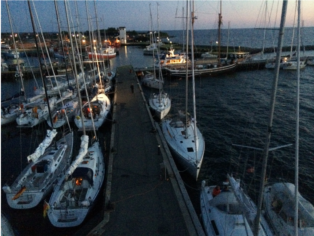
Letzte Station vor Deutschland – am Auffahrts-Abend: ... Heerscharen von Deutschen stürmen Dänemark