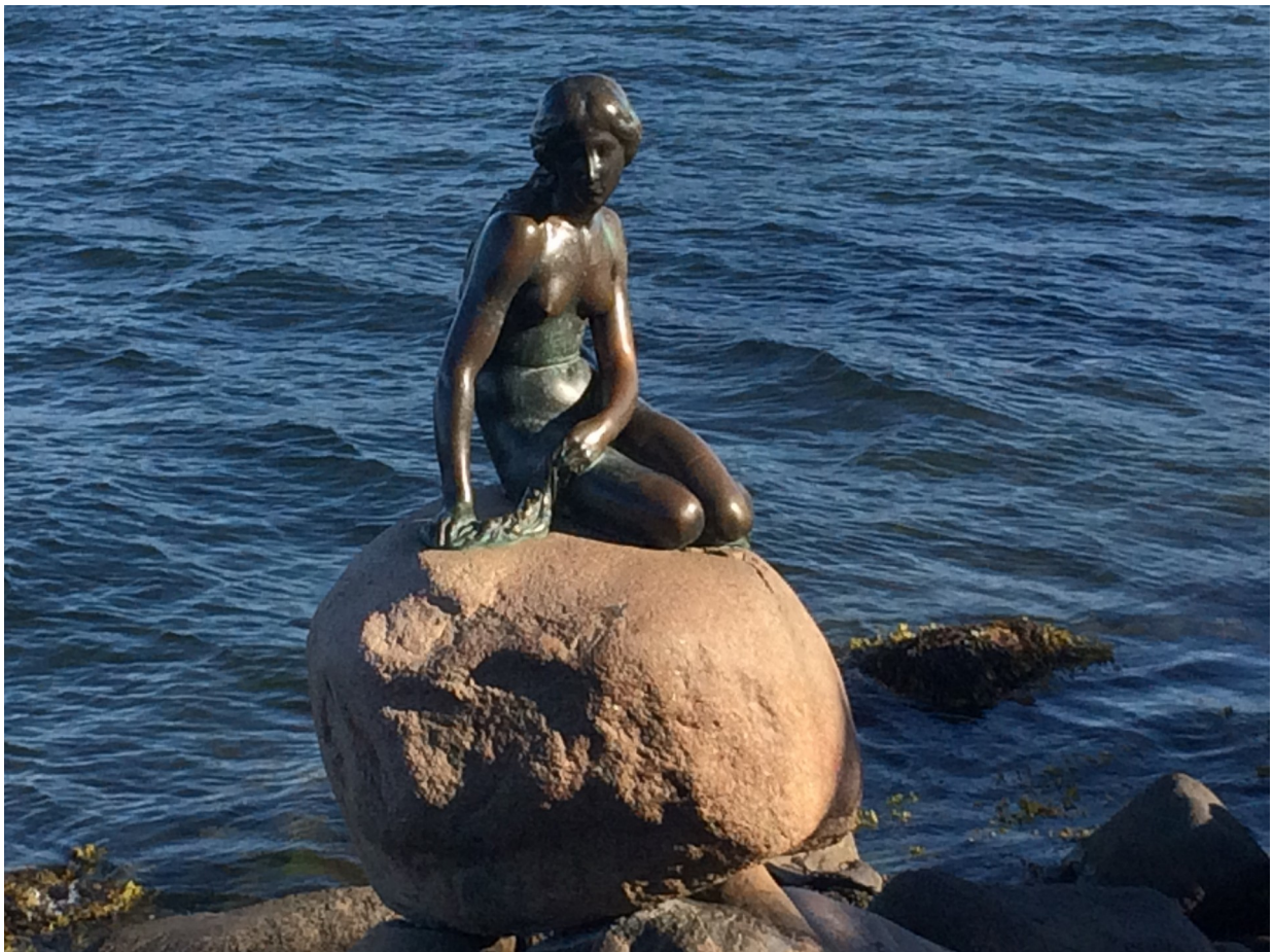
Das Ziel unseres Törns - Kopenhagen