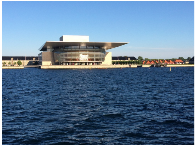
Impressionen aus Kopenhagen