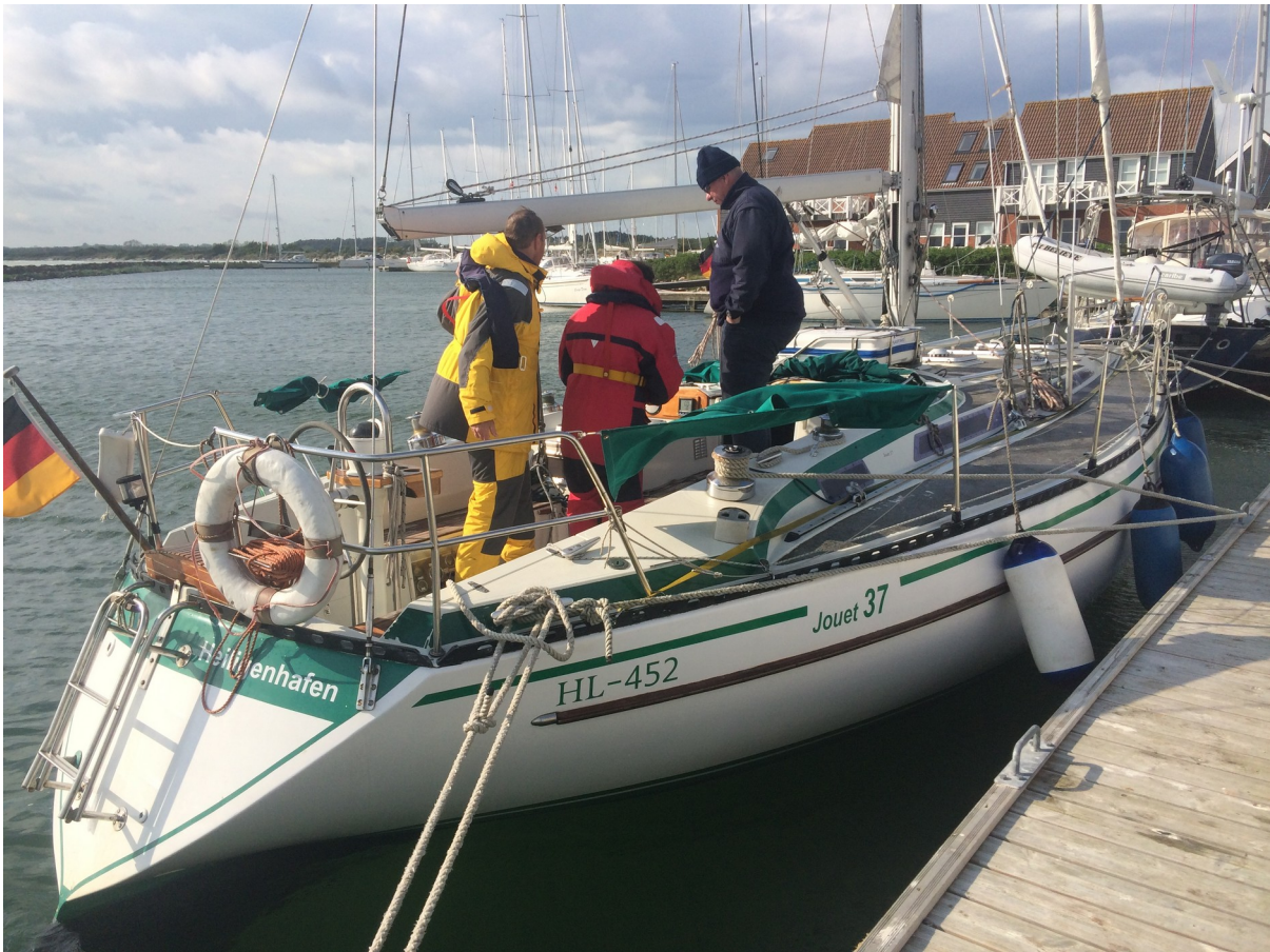
Unsere Kollegen nach dem haarsträubenden Erlebnis ... glücklicherweise unversehrt !