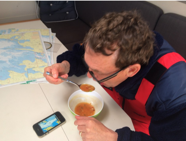
Als Manager am kontrollieren