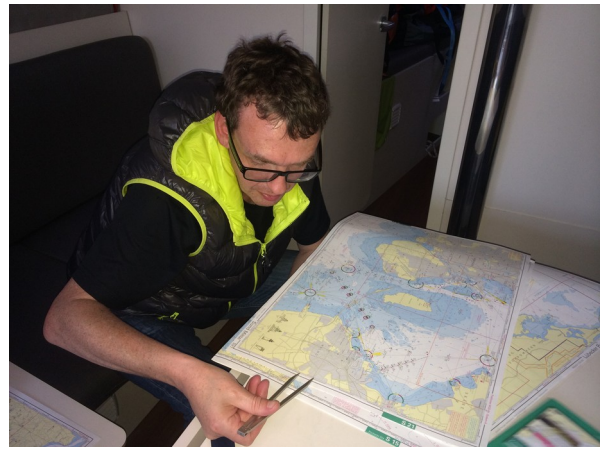
Ernsthaft am arbeiten