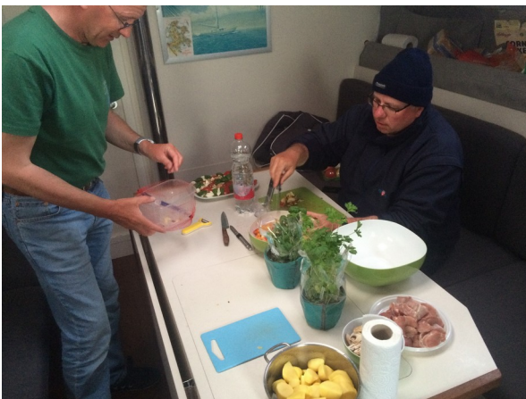
Wir päppelten sie wieder auf mit dem Capitanos Dinner