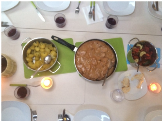
2) Schweins-Medaillons mit Beilagen