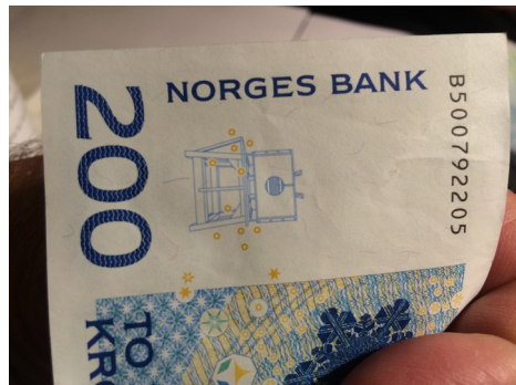
... und einer der Crew 44 versuchte noch sein «Falschgeld» in den Wirtschaftskreislauf einfließen zu lassen ...