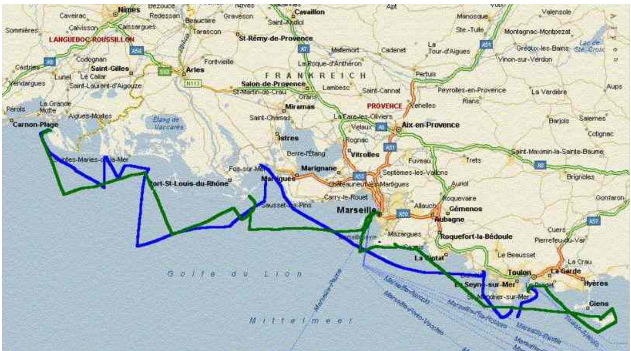
unser Trip entlang der Rhonemündung