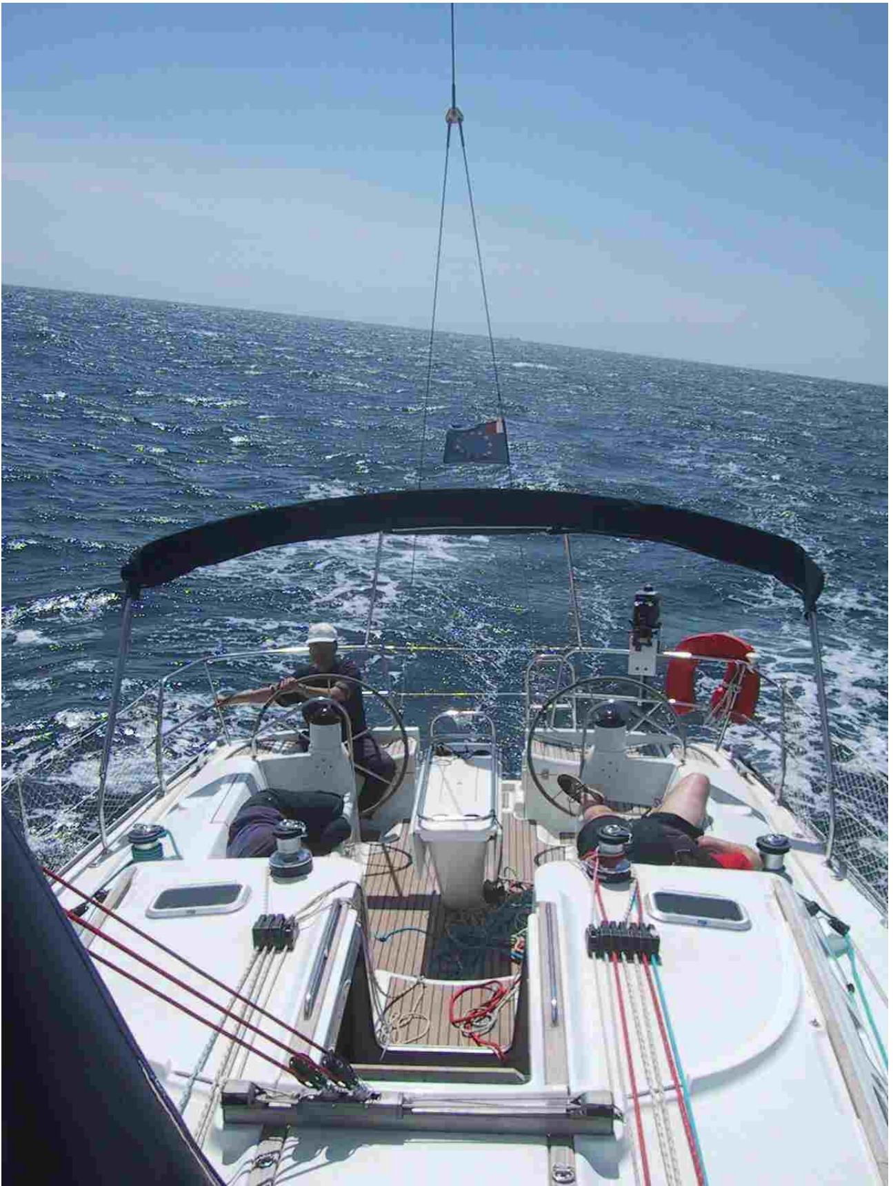
Toller halber Wind vor der Rhonemündung