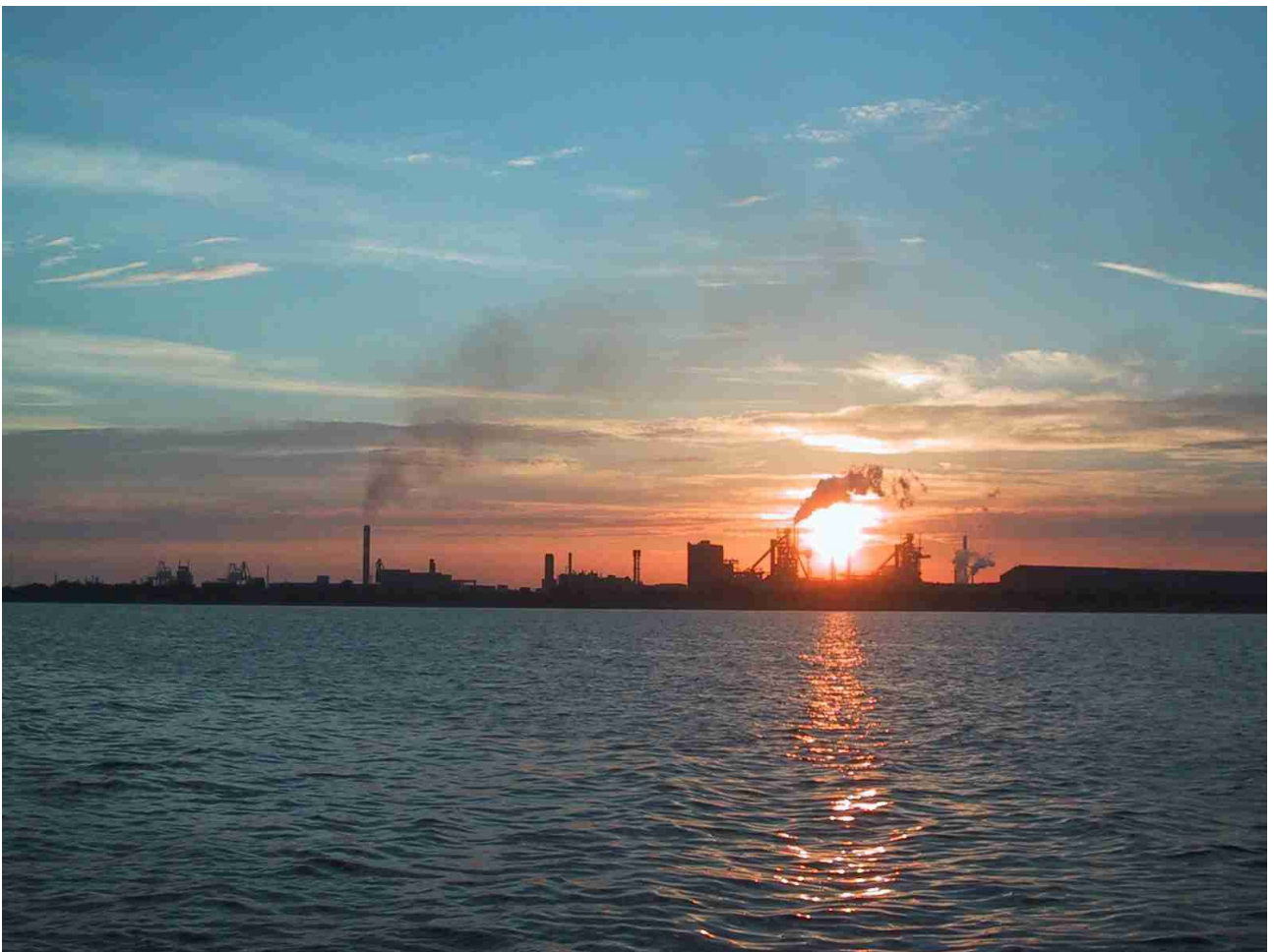
die Raffinerien im Port Fos du Sud