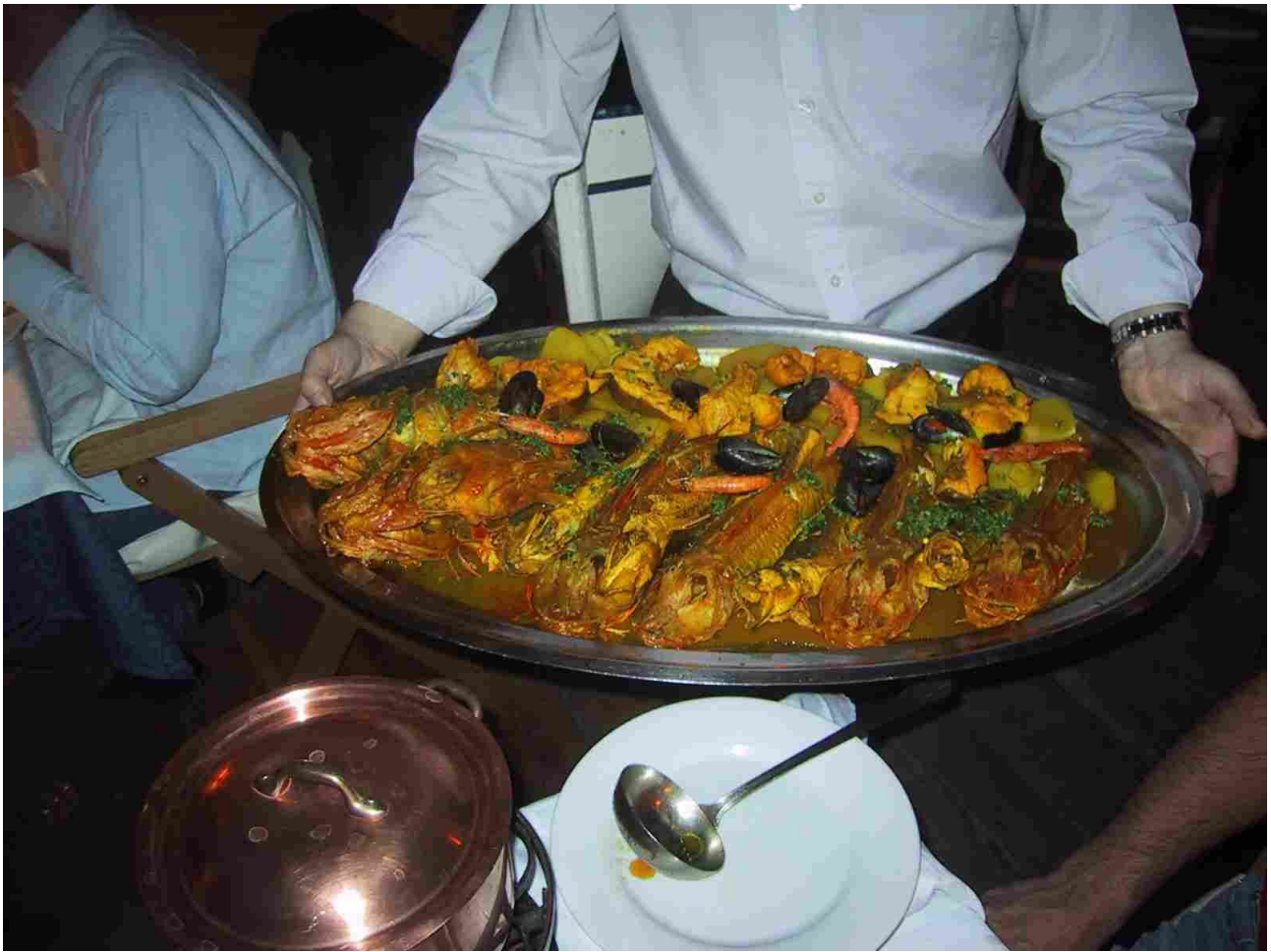
Eine Bouillabaisse ...