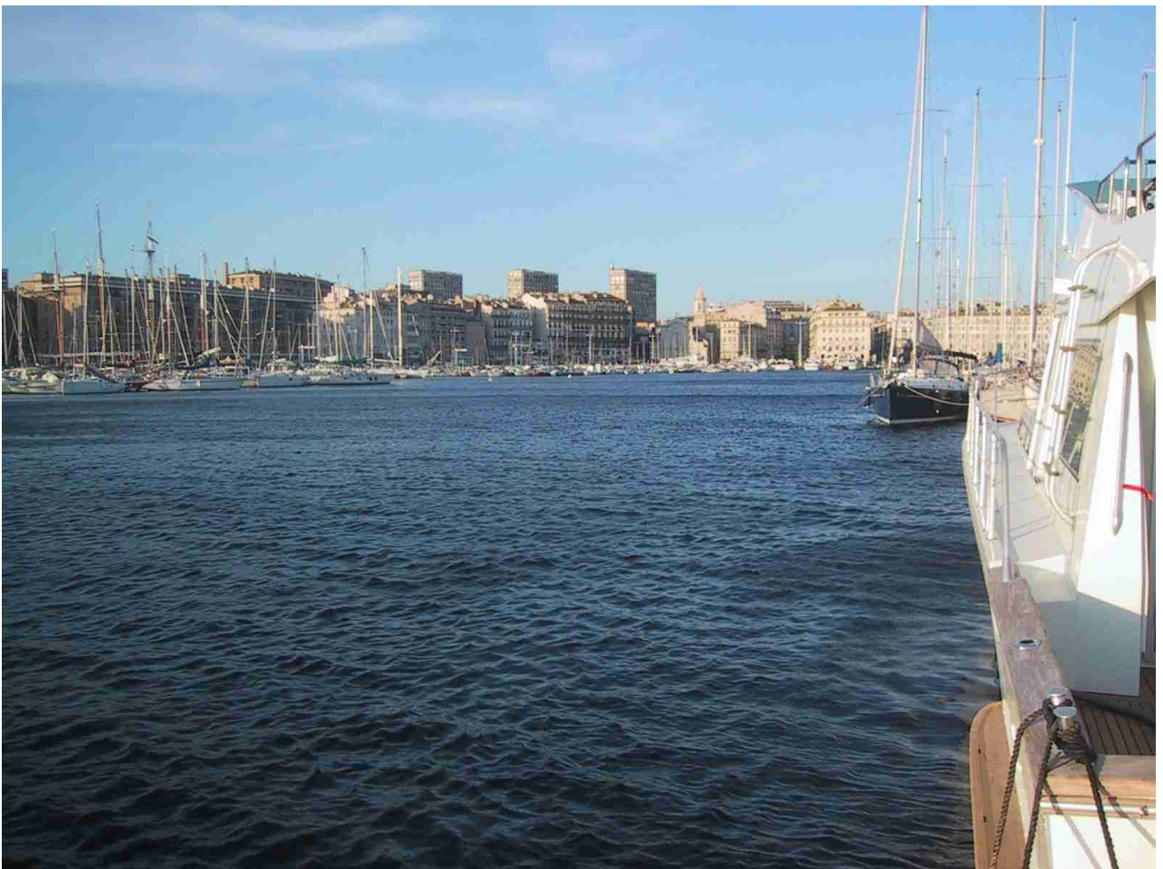
Le Vieux Port de Marseille