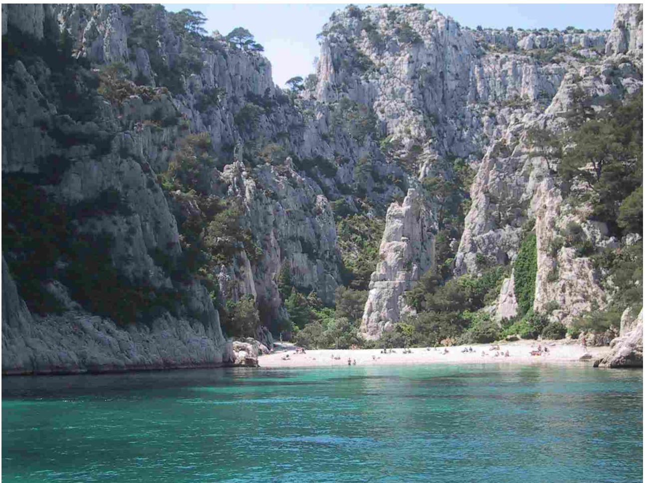
La Calanque en Vau