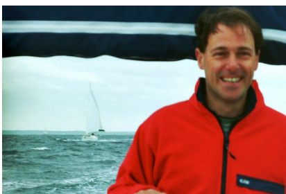
Auf Knotenjagd ...