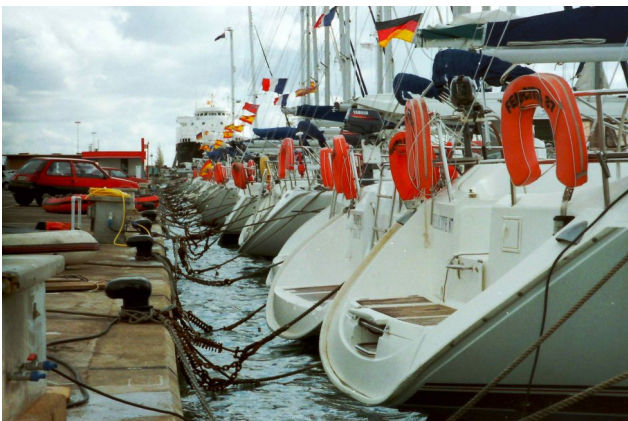
Wie im AMP