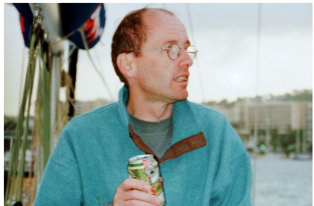
Der Capt`n nach dem ersten Törn