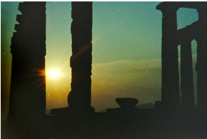
der Poseidon-Tempel auf Cap Sounion