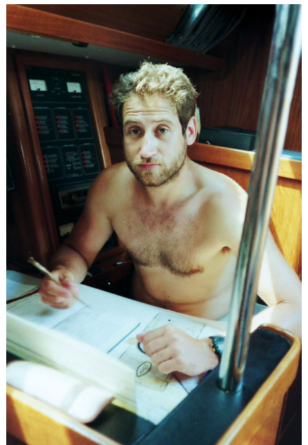
Abdetachiert in die Backmannschaft