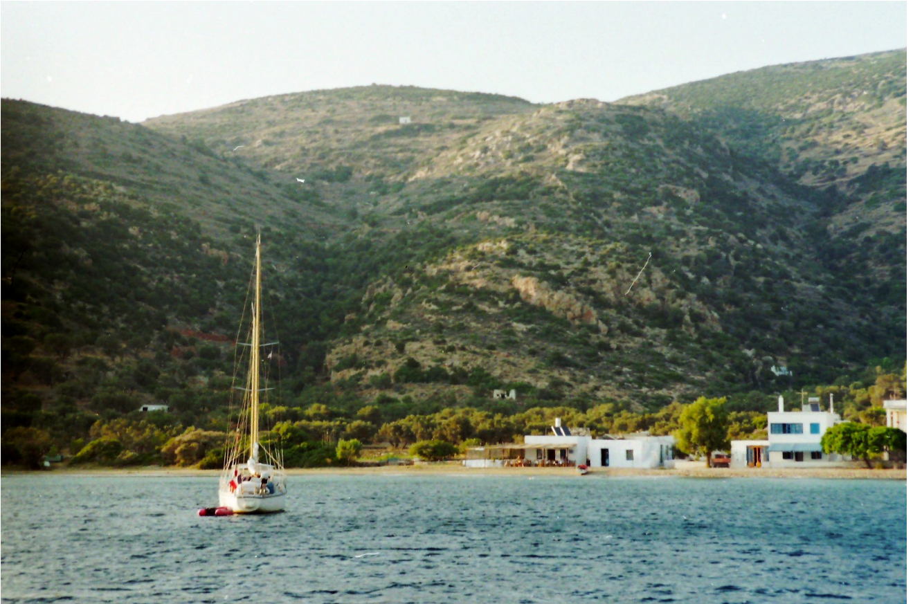
Eine Bucht im Süden von Siphnos – Fallböen ...